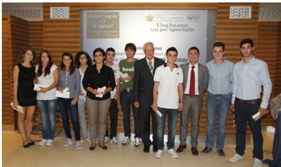
Nella foto i vincitori della prima edizione della Borsa di Studio